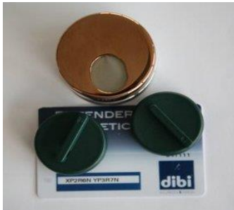
Kit defender "Key Protector" con chiavi e card